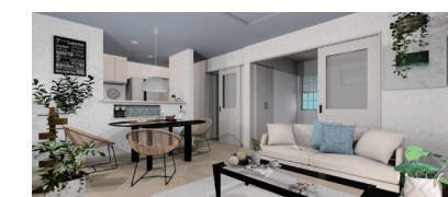
※イメージパースは図面を基に書き起こしたもので、実際とは異なります。