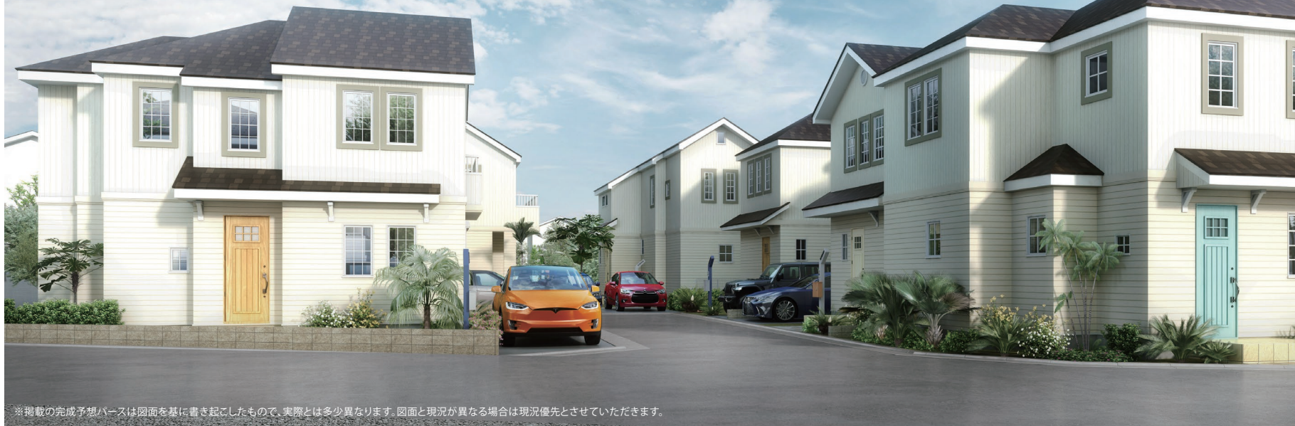
※掲載の完成予想パースは図面を基に書き起こしたもので、実際とは多少異なります。図面と現況が異なる場合は現況優先とさせていただきます。